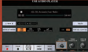
مشغل الصوت USB