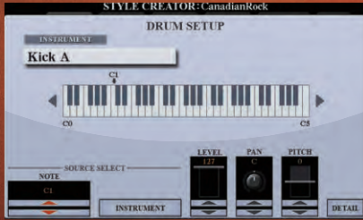
عرض إعداد الطبول

من وظيفة إنشاء الأنماط، يمكن تحرير عدة معلمات لمجموعة طبول بالتفصيل، وتستطيع دمج "الآلة" المفضلة مع عدة مجموعات طبول. استمتع بعزف الأنماط بمجموعة الطبول الفريدة لديك